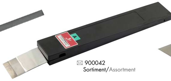
☒ 900042 Sortiment/Assortment