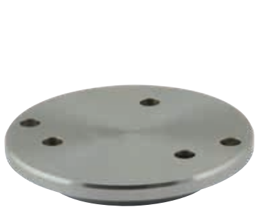
Typ 3 Type 3