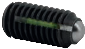
LONG-LOK Gewindegicherung LONG-LOK Thread lock